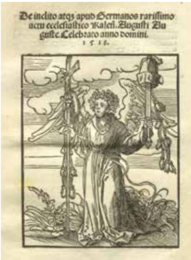
Überreichung des vom Papst gestifteten Schwerts und Helms an Kaiser Maximilian I. Druck von Jakob Mennel, 1518