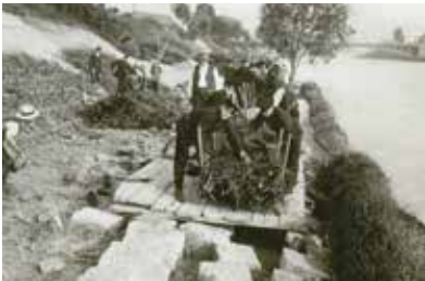
Ufersicherung am Lech, 1912

Eine Ausstellung präsentiert einmalige, z. T. unbekannte historische Dokumente aus den Beständen des Stadtarchivs zu den Lebenswelten der Augsburger Stadtbevölkerung und ihrem Umgang mit dem „blauen Element“. Eintritt frei