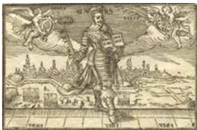
König Gustav Adolf v. Schweden als neuer Stadtherr in Augsburg, 1633