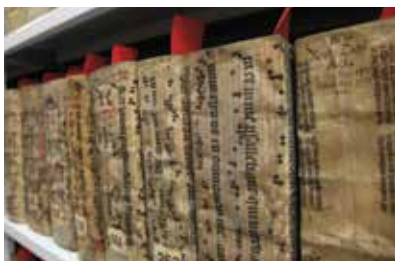
Dokumente der Reichsstadt Augsburg in einem der Archivmagazine