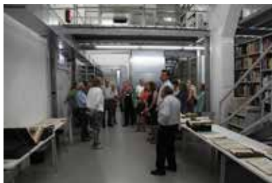
Einblick in eines der Archiv-magazine

Begrenzte Plätze, Anmeldung erforderlich Unkostenbeitrag: 5,00 €