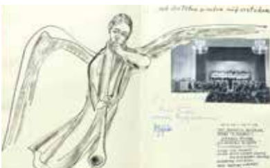
Aus der Chronik des Philharmonischen Chors (1964)

Kooperationsveranstaltung mit dem Philharmonischen Chor Augsburg Eintritt frei