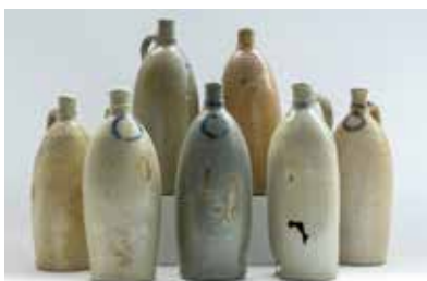
Sauerbrunnenkrüge – Fundstücke der Stadtarchäologie Augsburg

Renate Pfeuffer M. A., Augsburg Eintritt frei