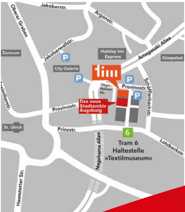
Titelbild: historischer Archivschrank des alten reichsstädtischen Archivs im Stadtarchiv Augsburg (1756)

Anfahrt mit dem Pkw: Begrenzte Parkmöglichkeiten auf den öffentlichen Parkplätzen vor dem Textilmuseum