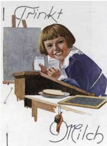
Werbeaufnahme, 1920/30er Jahre