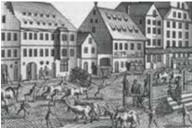
Ansicht des Holz- und Ochsenmarkts i. d. Jakobervorstadt, Staats- und Stadtbibliothek Augsburg, Graph. 17/6, Bl. 10.