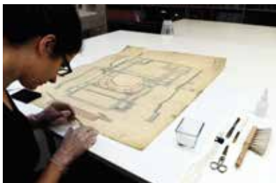
Konservatorische Arbeiten an Papierobjekten

Begrenzte Plätze, Anmeldung über die städt. Vorverkaufsstellen erforderlich