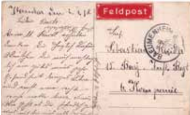
Feldpostkarte, 1918 (Privatbesitz)