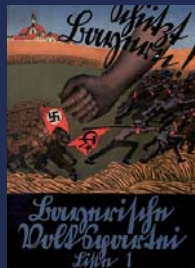
Wahlplakat der Bayerischen Volkspartei (vor 1933)