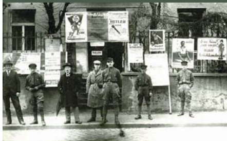
NSDAP-Anhänger vor einem Wahllokal anlässlich der Reichstags- und Kommunalwahlen 1924

Der Aufstieg des Nationalsozialismus bahnte sich lange vor 1933 an. In Augsburg bildeten sich schon ab 1921 Organisationsstrukturen der NSDAP heraus, begünstigt durch das völkische Milieu sowie die Nähe zu München als Zentrum der NS-Agitation. Unaufhörlich zogen die Anhänger Hitlers gegen die Weimarer Demokratie, die „Juden und Marxisten“ zu Felde. Ihre Demagogie zeigte in allen Teilen der Augsburger Bevölkerung Wirkung.