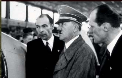
Hitler im Werk Messerschmitt II (21. November 1937)

Das NS-Regime hatte sich machtpolitisch nach innen und nach außen konsolidiert, die Wirtschaft erholte sich, doch stieg der Lebensstandard nur langsam an. Das Reich befand sich indes längst auf Kriegskurs. Auch in Augsburg wurden neue Kasernen gebaut und die Wirtschaft zunehmend auf Rüstungsproduktion umgestellt.