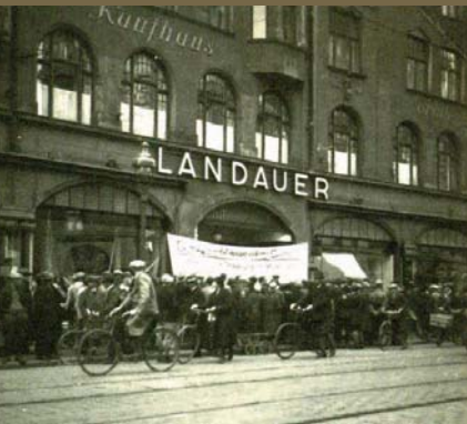
Boykottaufzug vor dem Kaufhaus Landauer (1. April 1933)

Ziel der Nationalsozialisten war es, eine nach rassistischen Kriterien aufgebaute „Volksgemeinschaft“ zu formen. Die Würde des Einzelnen hatte keine Gültigkeit mehr, es zählte nur noch sein Wert für das Volk. Mutmaßliche und tatsächliche Gegner des Nationalsozialismus wurden massiv bedrängt und verfolgt. Die beiden Hauptzielgruppen waren die politische Linke, allen voran Kommunisten und Sozialdemokraten und – von Beginn an – die jüdische Bevölkerung.