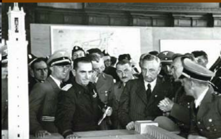
Eine Abordnung italienischer Jungfaschisten besichtigt das Modell des Augsburger Gauforums im Rathaus (4. August 1939)

Mit überdimensionierten Bauten eines Gauforums, die die alte reichstädtische Zentralachse überbieten sollten, wollte die nationalsozialistische Führung der Stadt ihren Stempel aufdrücken und dadurch ein „neues Augsburg“ erschaffen. Der Zweite Weltkrieg, auf den das NS-Regime zielstrebig zusteuerte, machte alle Visionen zunichte. Am Ende lag die Stadt in Trümmern.